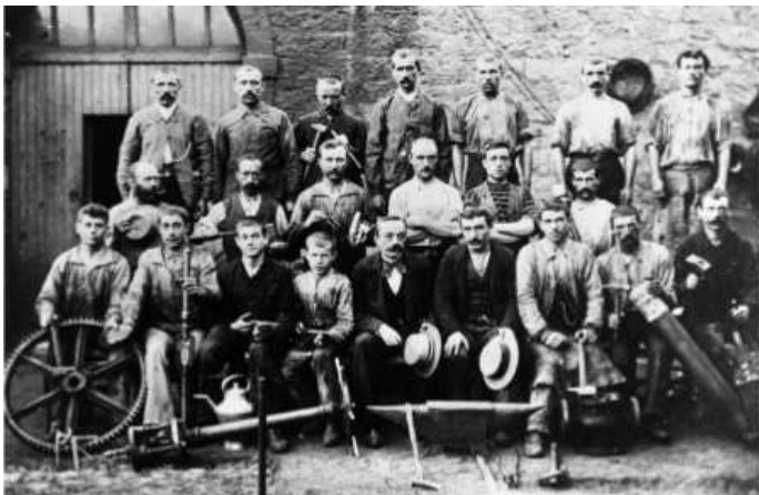
45 Fi 5263 : Hommes et enfants employés aux ateliers d'entretien, 1895-1900.