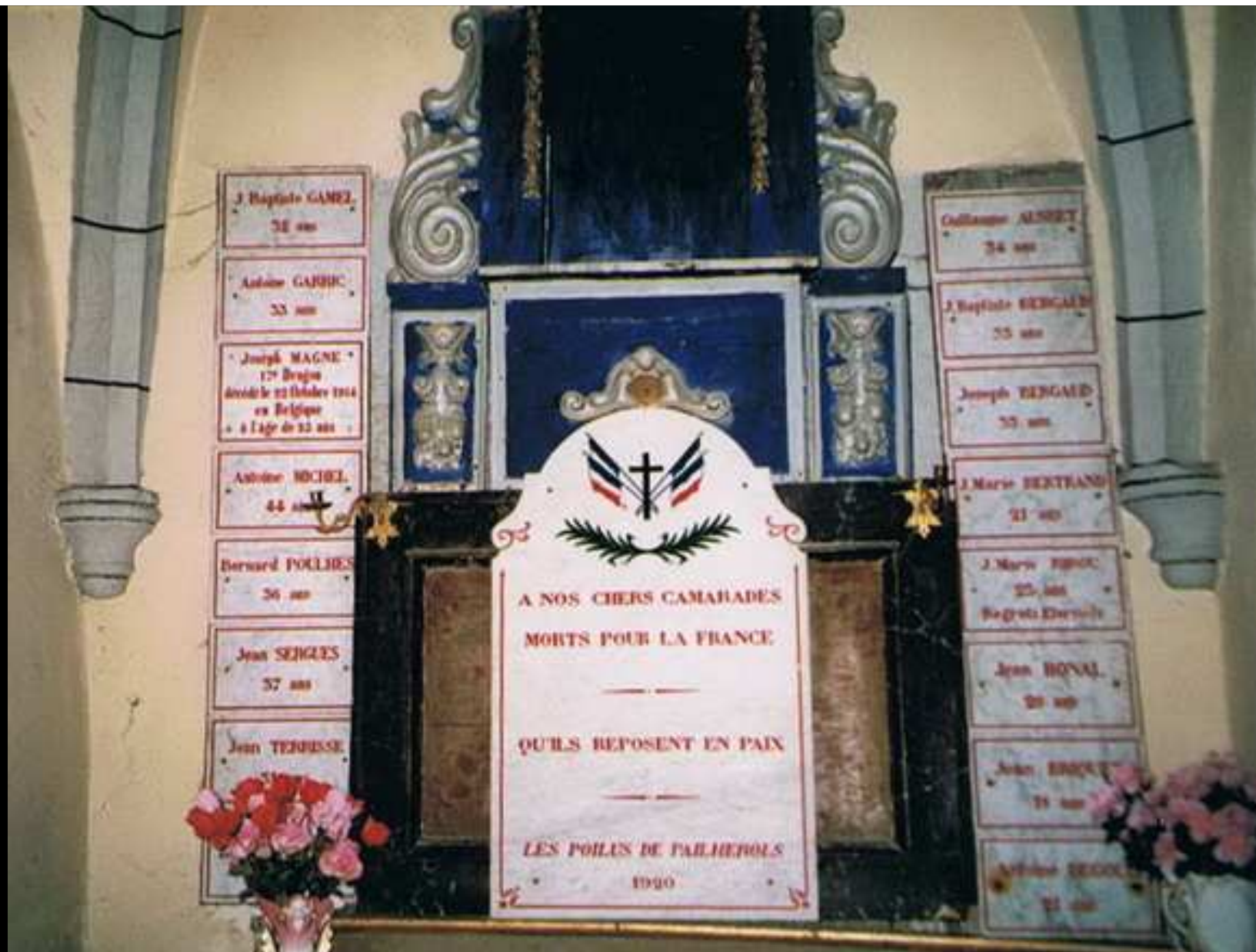
Église « Notre Dame de l' ASSOMPTION » 22 noms gravés