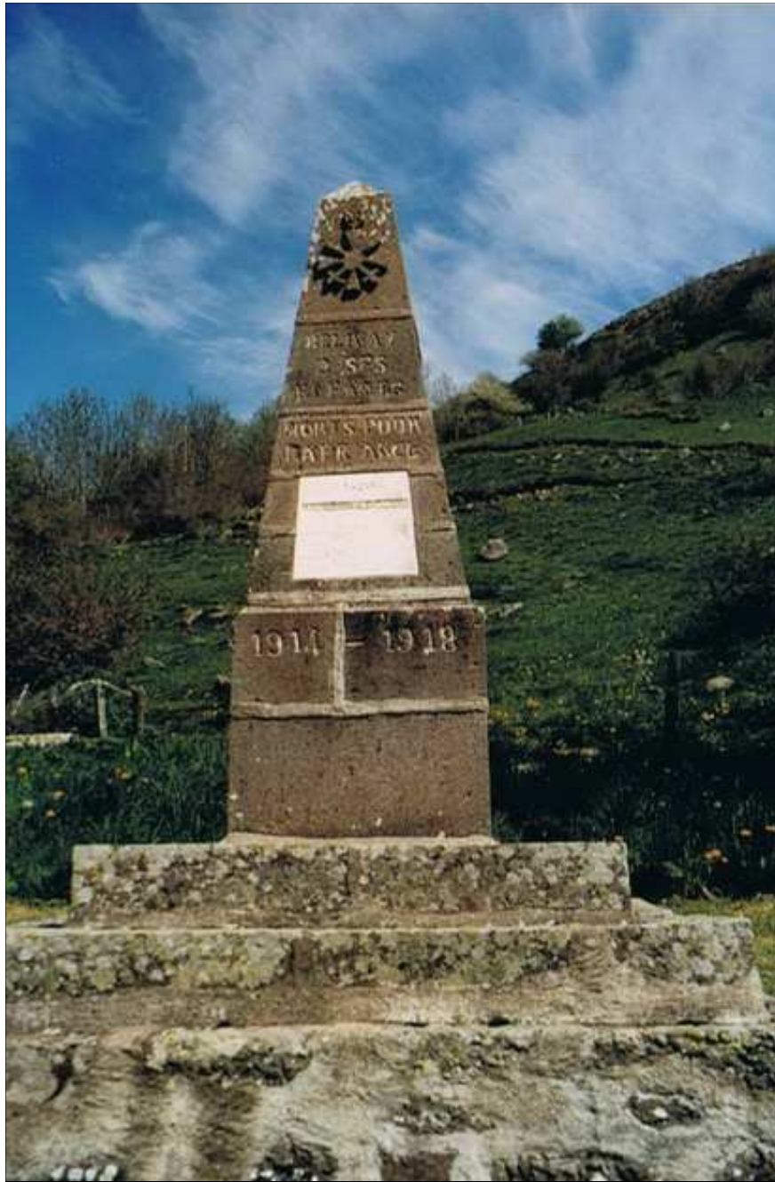
VILLAGE DE BELINAY