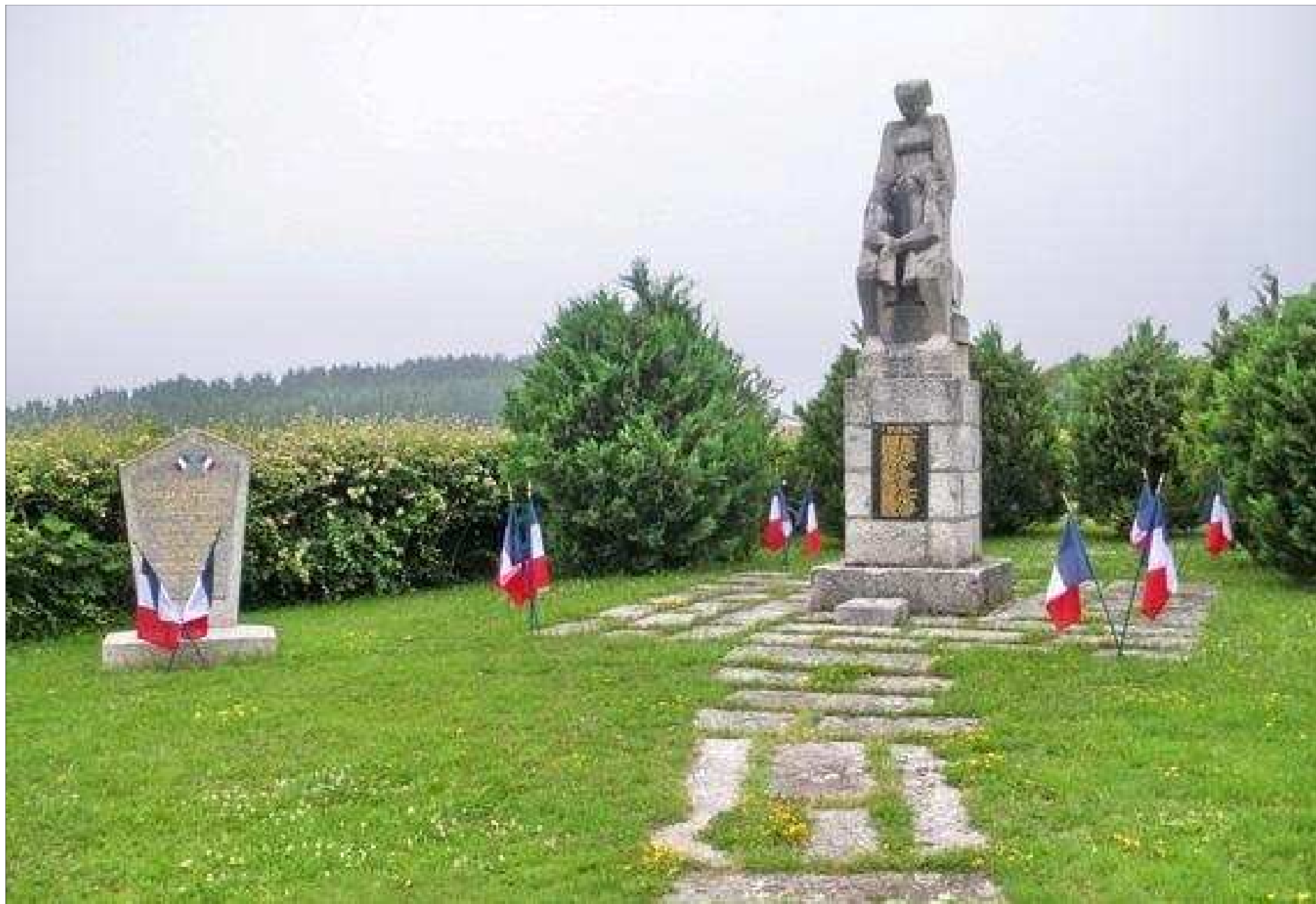
MONUMENT PLACE DU 10 JUIN 1944. 26 NOMS GRAVÉS SUR LE MONUMENT