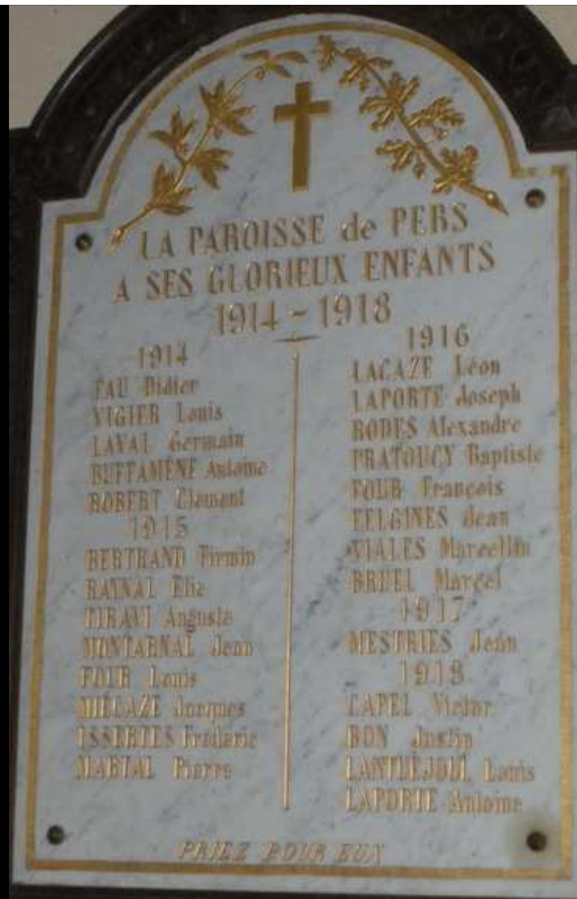
Église « St MARTIN » 26 noms gravés