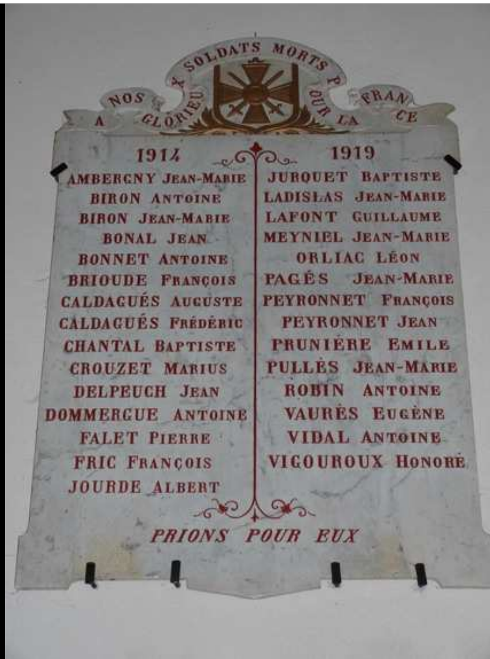
Église « St SATURNIN » 29 noms gravés