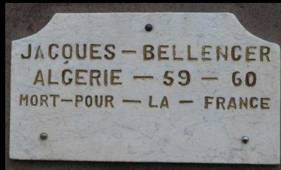
DÉTAILS MONUMENT DU SOUVENIR