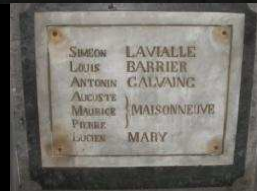
Église « Ste CROIX » 27 noms gravés