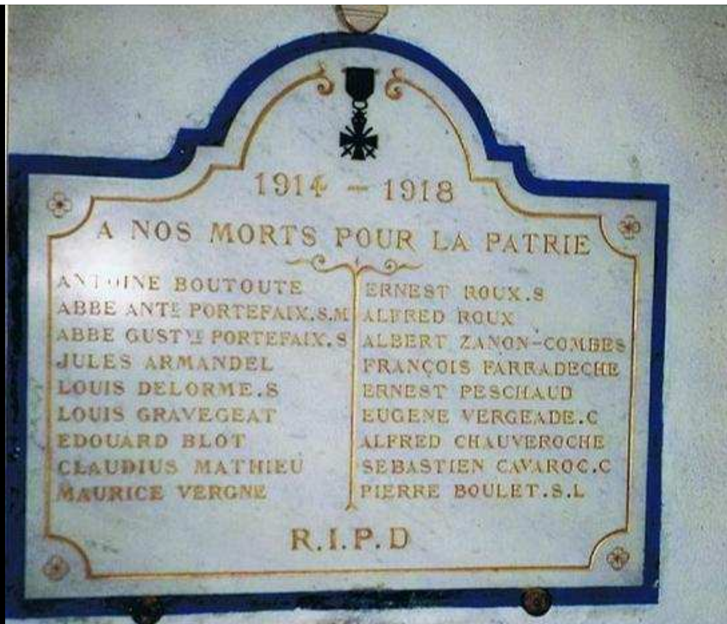
Église « St ANASTASIE » 18 noms gravés