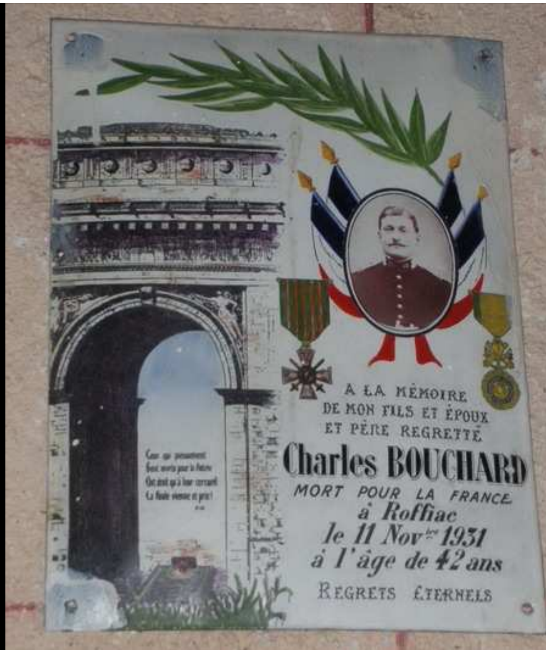
Église « St GAL » uniquement une plaque souvenir d'une famille