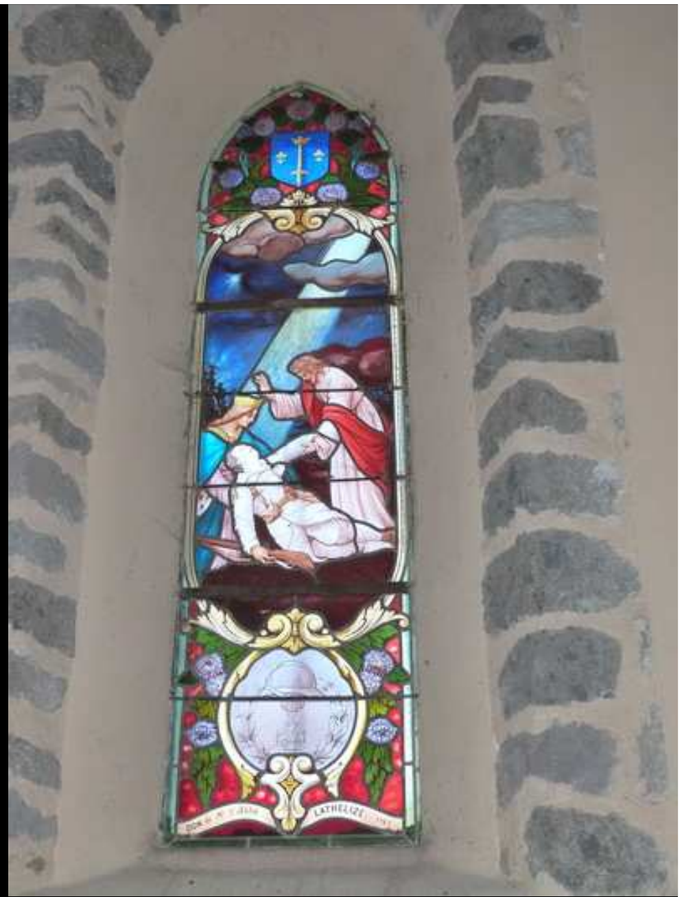
Église « St VICTOR » 46 noms gravés