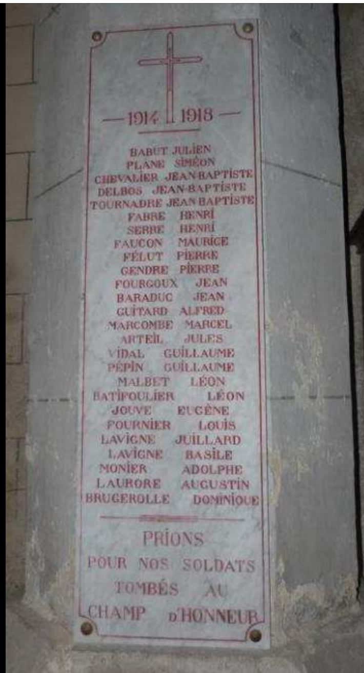
Église « St BONNET » 26 noms gravés