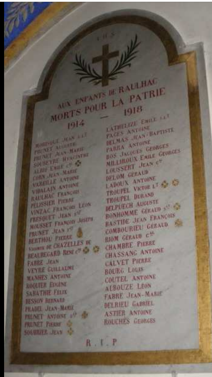
Église « St PIERRE » 52 noms gravés