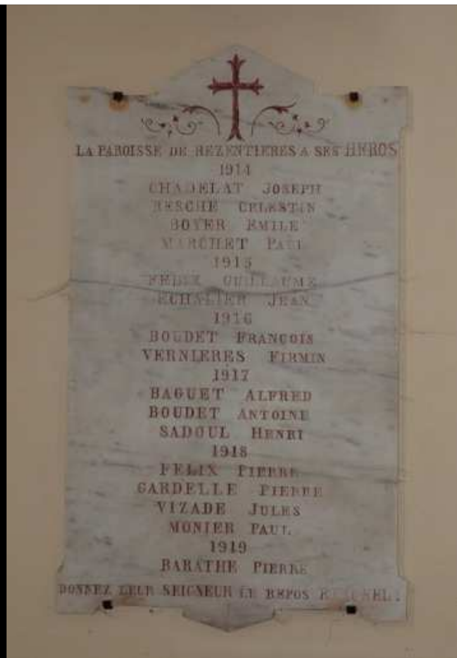
Église « Ste MADELEINE » 16 noms gravés