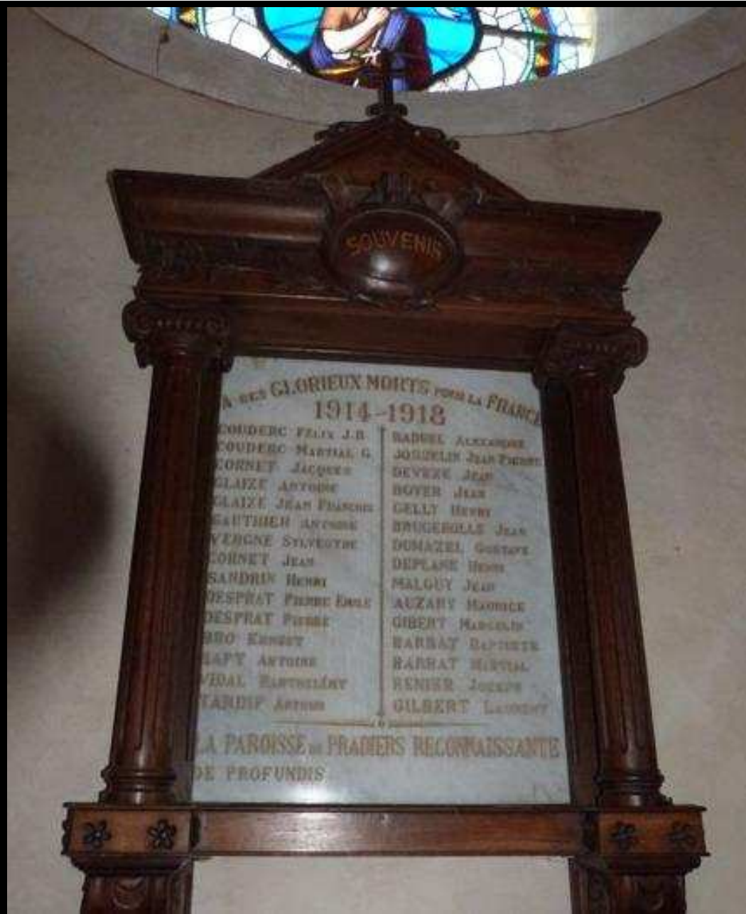
Église « St JEAN BAPTISTE » 30 noms gravés