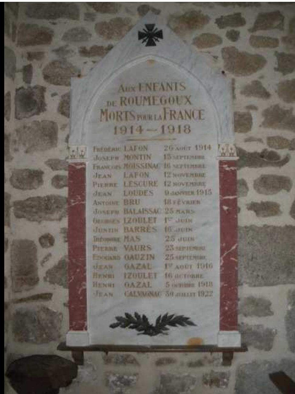
Église « St PAUL » 17 noms gravés