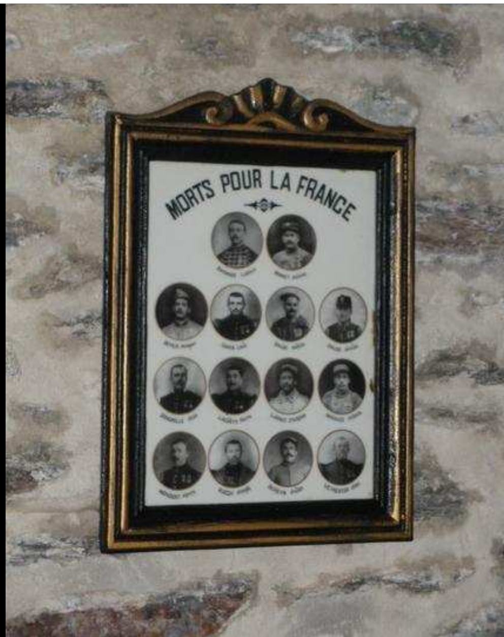
Eglise « St REMY » 14 photos