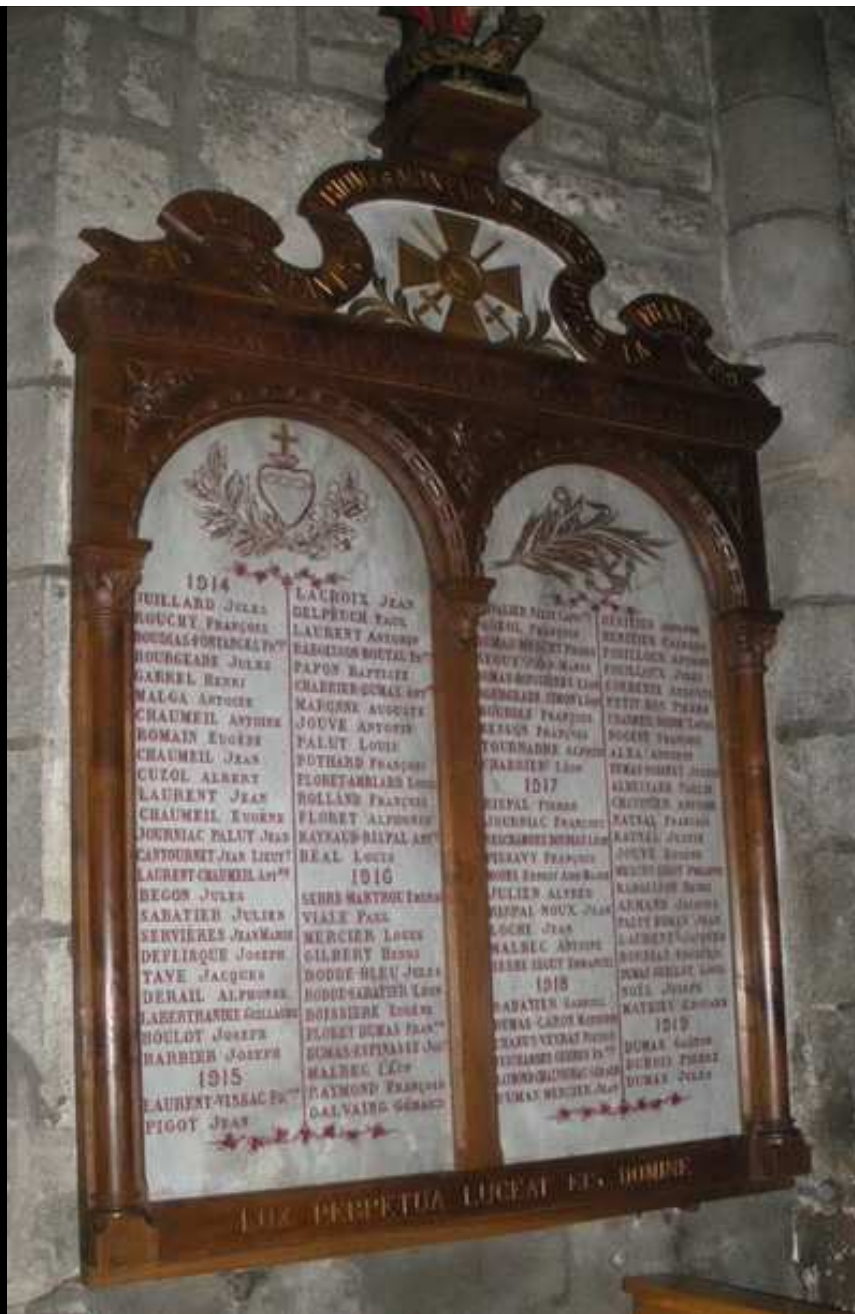
Église « St GEORGES » 107 noms gravés