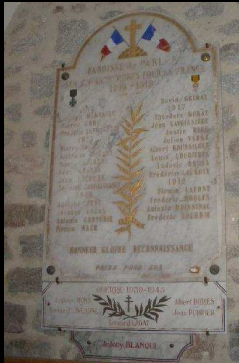
Église « St GEORGES » 23 noms gravés. Plaque signée ROQUES marbrier à AURILLAC