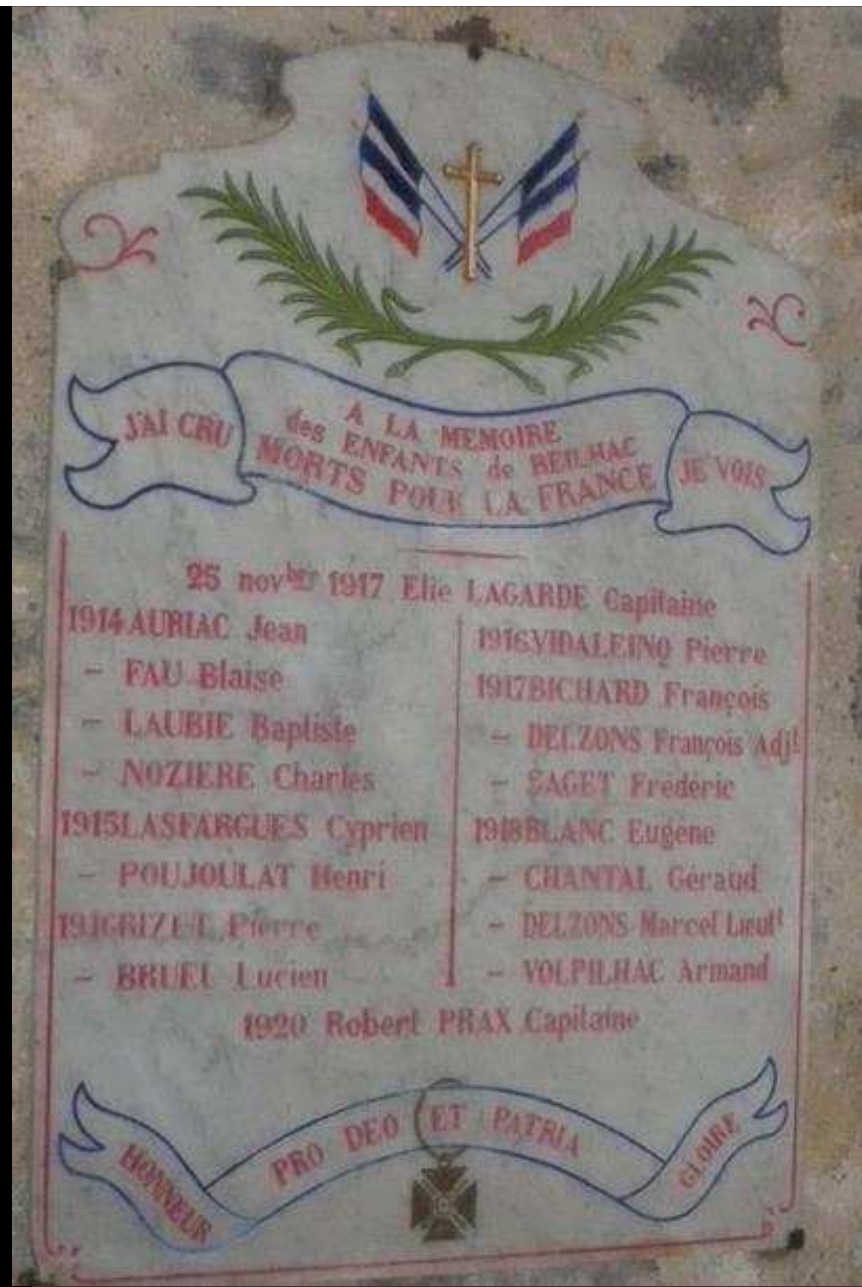
Église « St PIERRE » 18 noms gravés