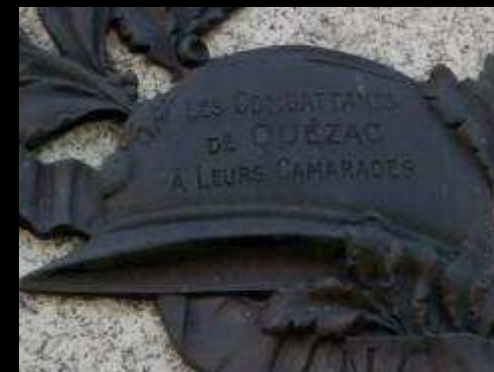
DÉTAILS MONUMENT DU SOUVENIR