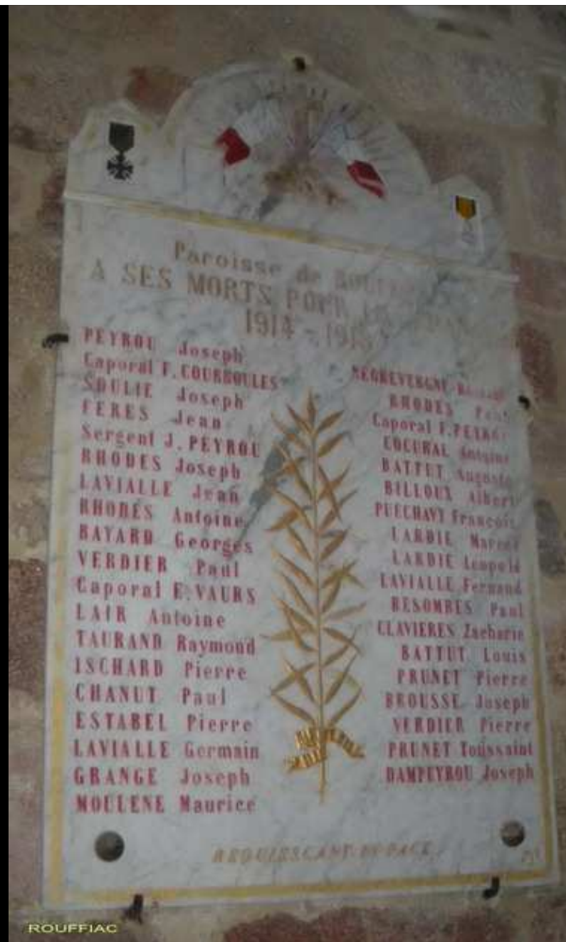
Église « St MARTIN » 36 noms gravés