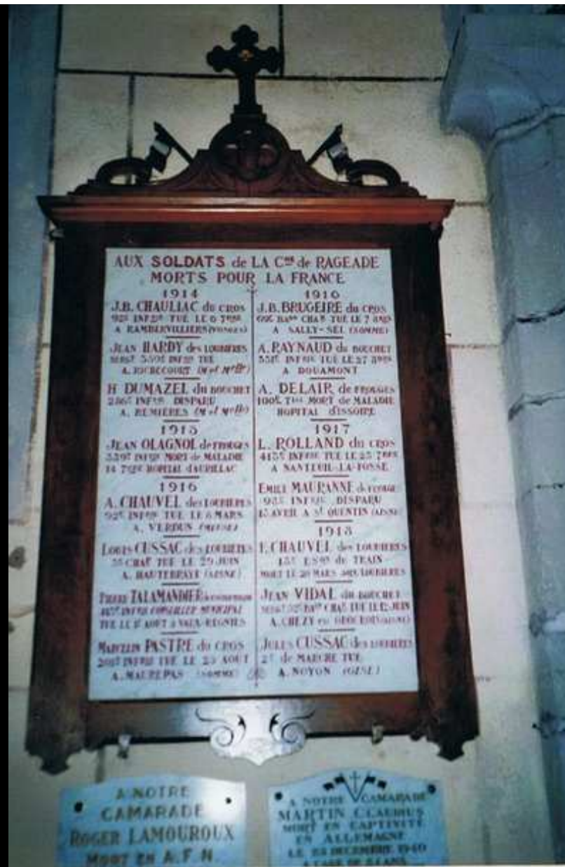
Église « St PIERRE » 52 noms gravés