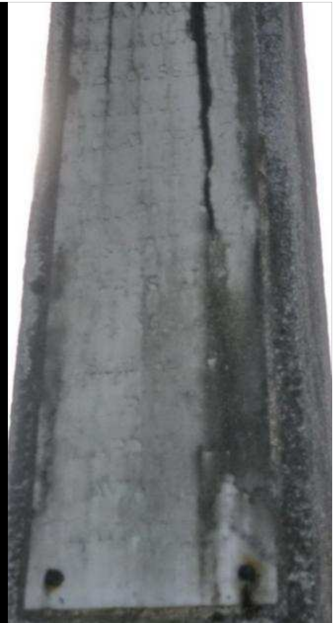
DÉTAILS MONUMENT DU SOUVENIR- 36 noms gravés, effacés par le temps