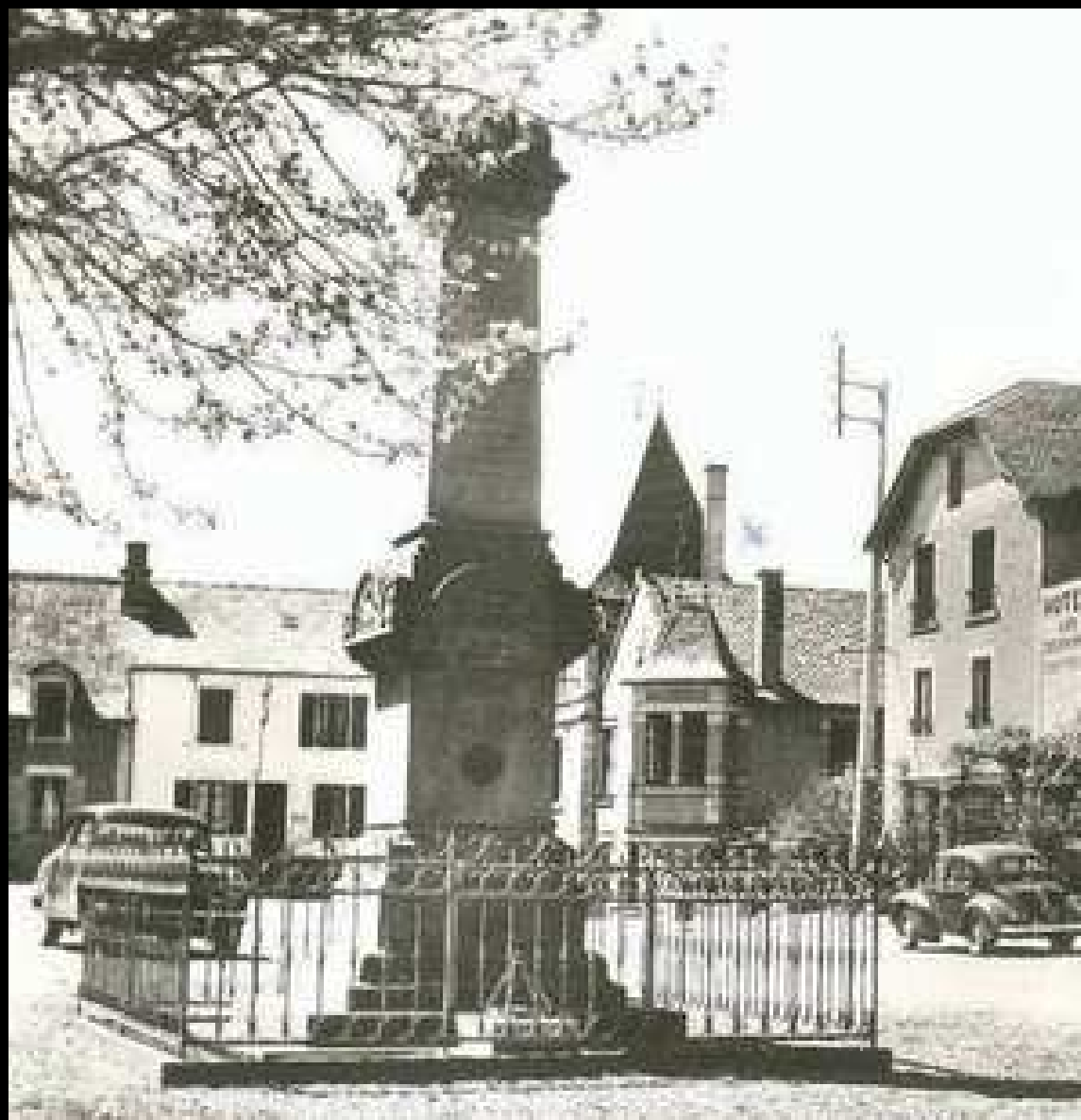
CARTE POSTALE ANCIENNE