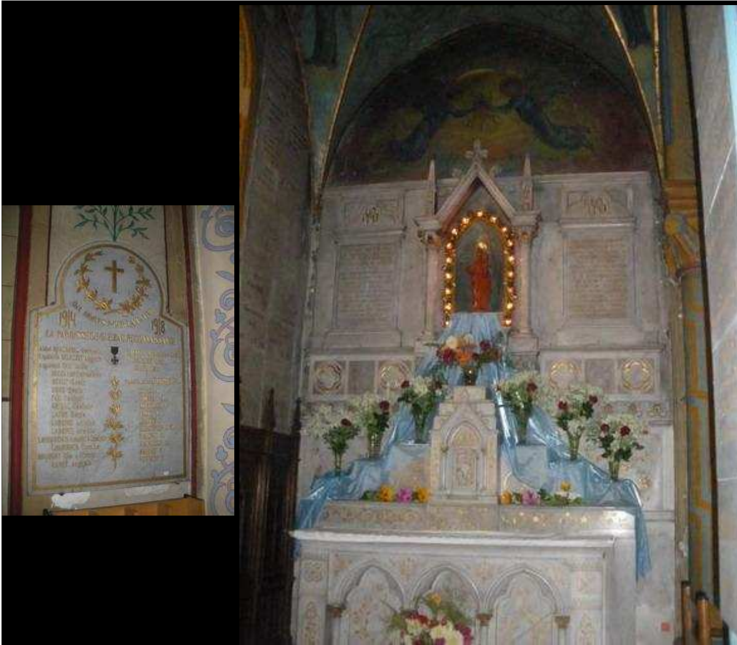
Église « Notre Dame de QUEZAC » 31 noms gravés