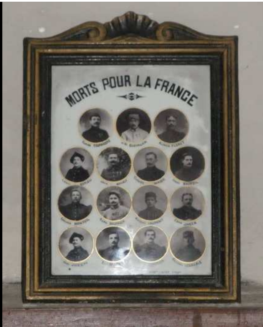
Église « St ETIENNE » 15 médaillons sur un cadre